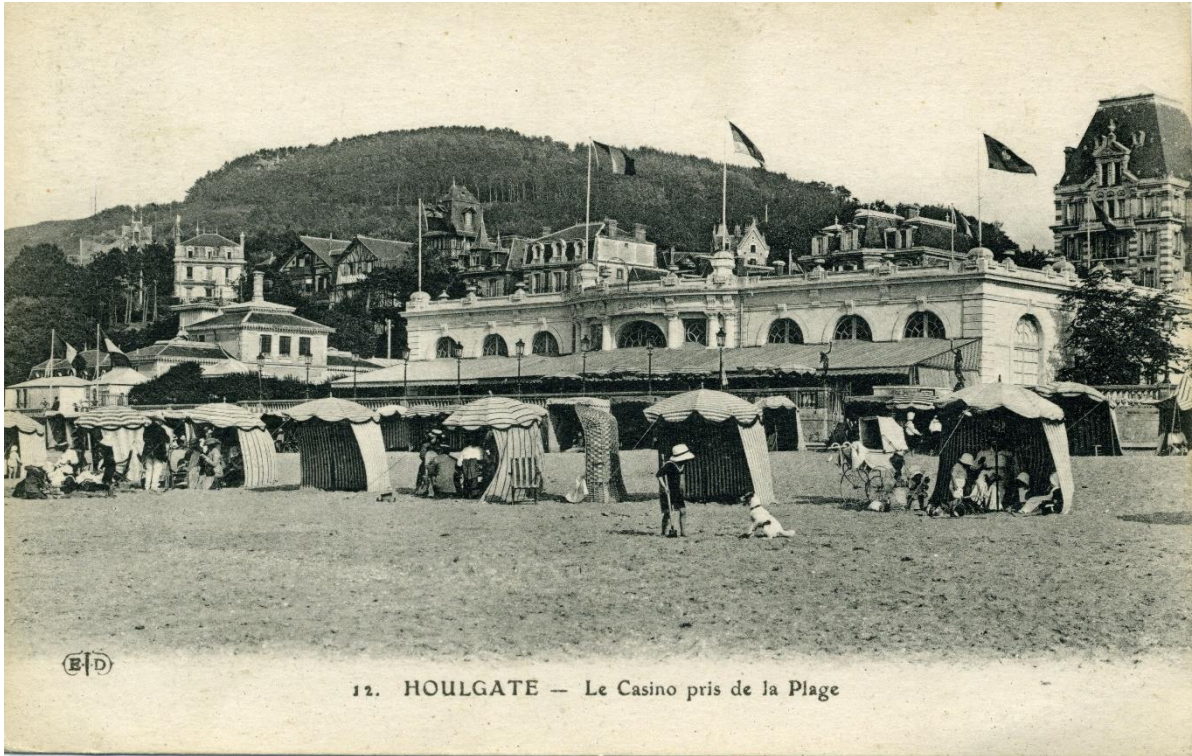
12. HOULGATE — Le Casino pris de la Plage